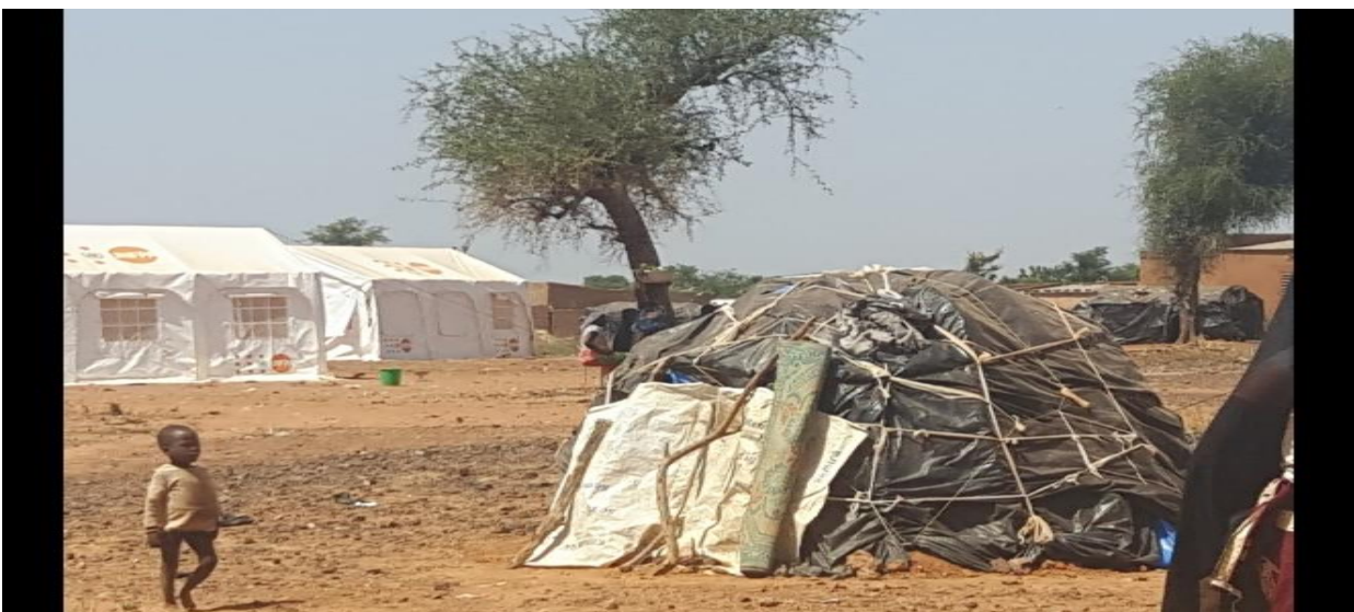
Tableau 2 : photo visite sur les sites d'accueil des PDI de Kongoussi Novembre 2019

Des vivres ont été distribués dans le centre Nord (Foubé Barsalogho) et le Sahel (Arbinda) avec les Articles Ménagers Essentiels (AME), qui comprenaient les couvertures, nattes, moustiquaires, kits de cuisine, bidons, kits hygiéniques, pots, bâches, brosses à dents, savons, seaux.