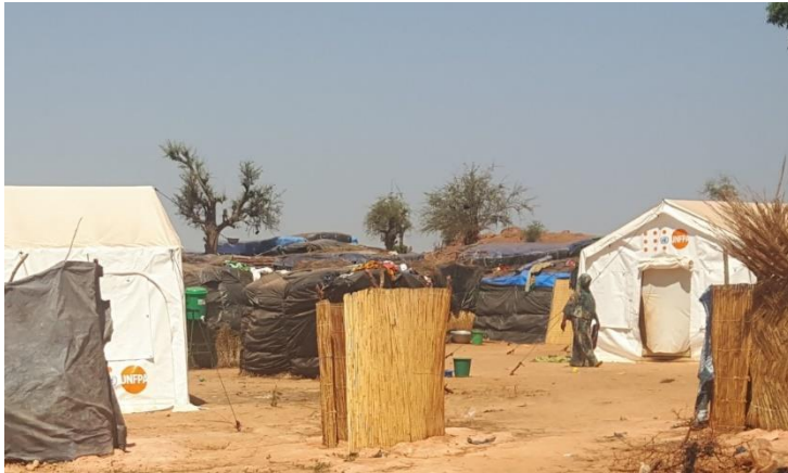
Figure 3 : photo prise sur un site d'accueil des PDI à Kongoussi

Au regard du bilan des actions en termes d'abris et d'octroi de matériel de survie, et tenant compte de l'observation sur les sites d'accueil des PDI, les abris et le matériel fournis répondent à un besoin d'urgence des PDI d'avoir un lieu pour se mettre à couvert ainsi que du matériel